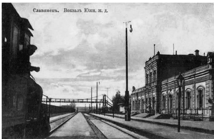
Вокзал ст. Славянск Южных железных дорог. Фотокопия старинной открытки